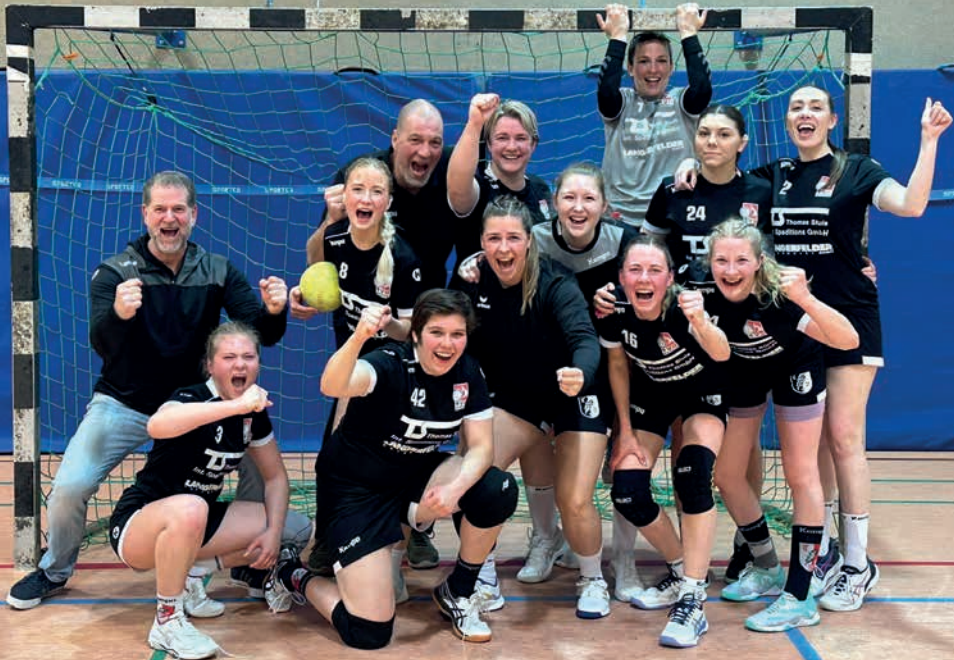
Jubel nach dem Derby-Sieg der 2.Frauen gegen den LTV Wuppertal

Leistung mit 22:18 bezwungen, und auch das letzte Spiel in Wülfrath wurde gewonnen, so dass man am Ende noch Boden gut machen konnte. Für die kommende Saison hat sich das Trainerteam eine Platzierung unter den ersten Vier als Ziel gesetzt. Das sollte angesichts des vorhandenen Potentials eine durch-aus realistische Zielsetzung sein.